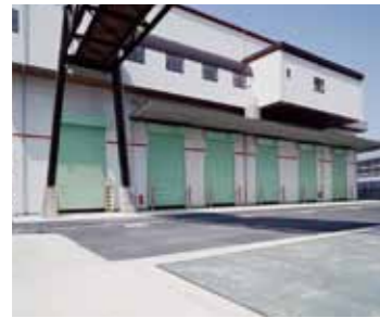
投入ステージ及びごみ投入口