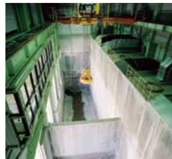
可燃性分別ごみピット (手前は汚泥ピット)