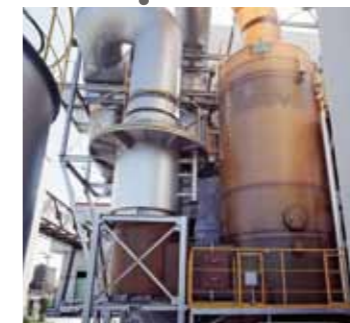
湿式有害ガス除去設備