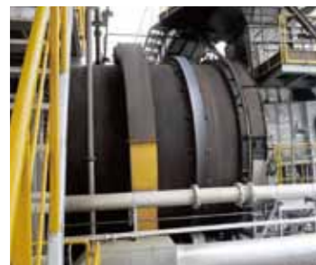
ロータリーキルン