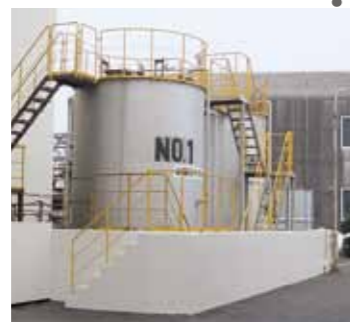
水酸化マグネシウムタンク